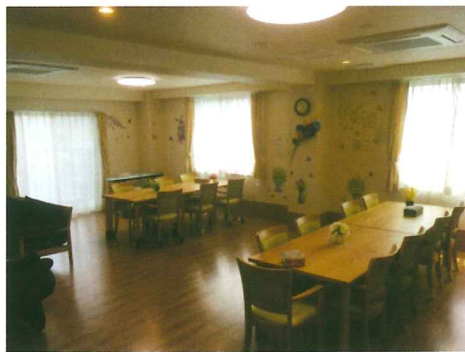
入居者が集う談話室 (3F)