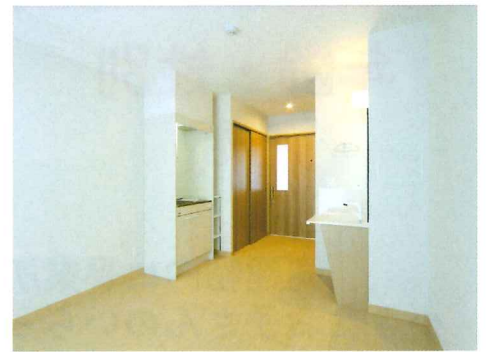
暖かい南向きのお部屋